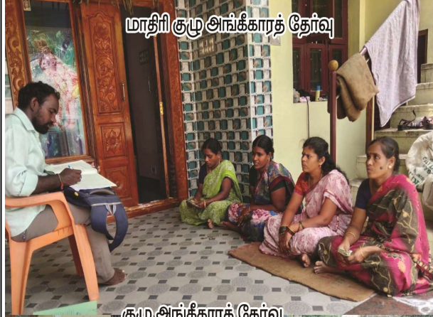
மாதிரி குழு அங்கீகாரத் தேர்வு