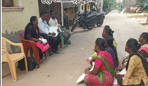
குழு அங்கீகாரத் தேர்வு