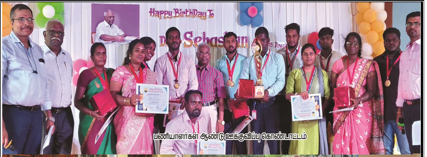
பணியாளர்கள் ஆண்டு உக்குவிய்பு கொண்டாட்டம்