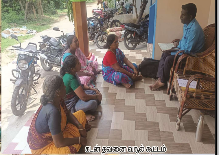
கடன் தவணை வசூல் கூட்டம்