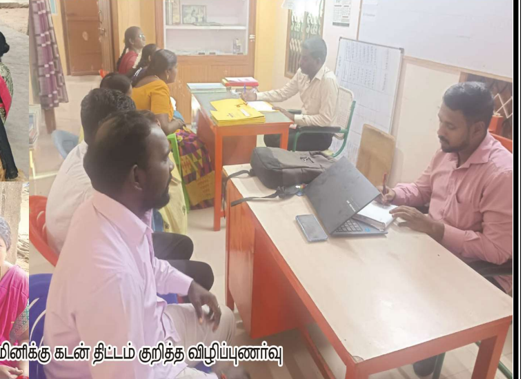
உறுப்பினர் மற்றும் நாமினிக்கு கடன் திட்டம் குறித்த விழிப்புணர்வு